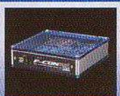
HKS F-CON is / VALCON TRUST v-manage / e-manage Ultimate 現車合わせセッティング ¥31,500 (税込)