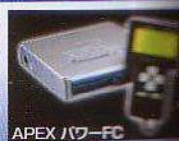
APEX Power-FC 現車合わせセッティング ¥52,500 (税込)

オイル交換~エンジンのオーバーホール、車検まで通常メンテナンスすべてお任せください!!