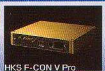
HKS F-CON V Pro 現車合わせセッティング ¥105,000 (税込)