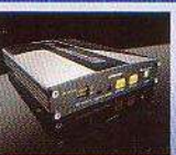
APEX Power-FC 現車合わせセッティング ¥52,500 (税込)